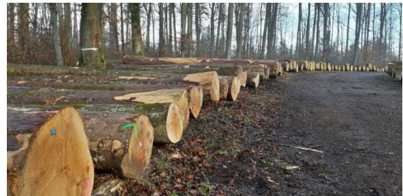
Wertholzlagerplatz Rheinfelden im Frühling 2018.

Wer Wertholz anmelden möchte ist nicht zu spät. Melden Sie sich bis spätestens am 16. November 2018 bei der Geschäftsstelle WaldholzAargau (056 221 89 72) oder direkt beim Lagerplatzchef in ihrer Region. Eine rege Beteiligung würde uns freuen.